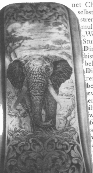
KAUM ZU GLAUBEN: Der Elefant besteht aus Millionen von Stichen.

Diese Bilder müssen für den Kunden natürlich sichtbar werden. Deshalb fertigt Kieser zunächst eine Zeichnung an. Hat man sich auf die Gestaltung geeinigt, bietet der Graveur darüber hinaus ein Gemälde zur Gravur an. Schon diese Großbilder besitzen einen ganz eigenen künstlerischen Ausdruck, denn Kieser hat dafür seine eigene Freskotechnik entwickelt.